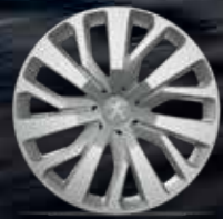
16" RAKIURA Jant Kapakları