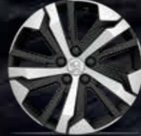
17" AORAKI Alüminyum Alaşım Jant