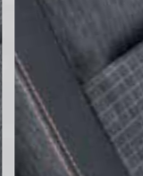
CASUAL turuncu dikişli kumaş döşeme