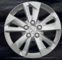
16" TARANAKI Alüminyum Alaşım Jant