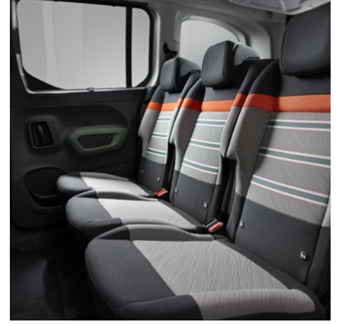
3 bağımsız arka koltuk ve tamamen düz bir zemin oluşturma imkanı