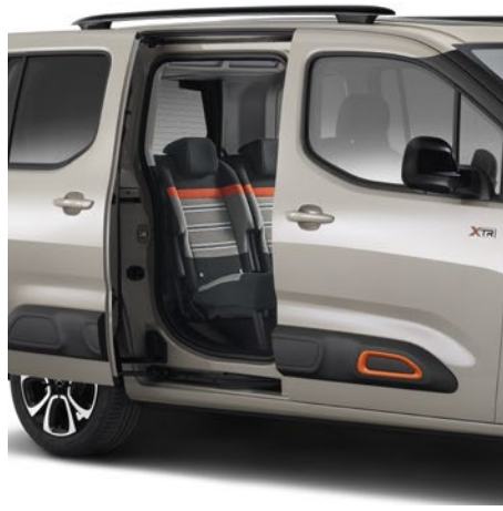
İki adet sürgülü yan kapı