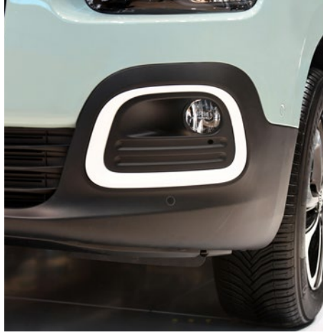
Çerçevesi sis farları