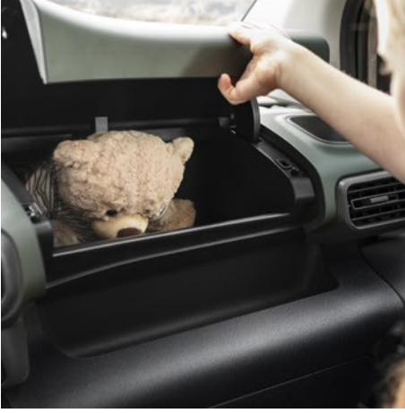
Top box torpido gözü