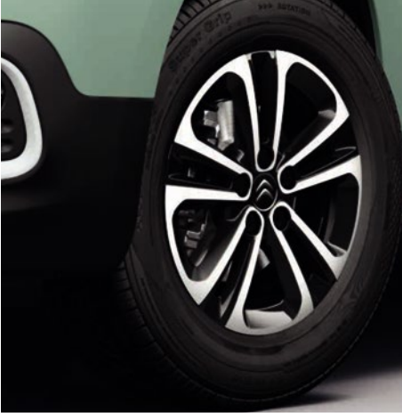
16" Starlit Alaşımlı Jant